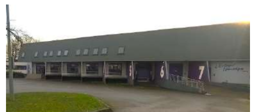
2 rue François Hennebique 62223 SAINT LAURENT BLANGY